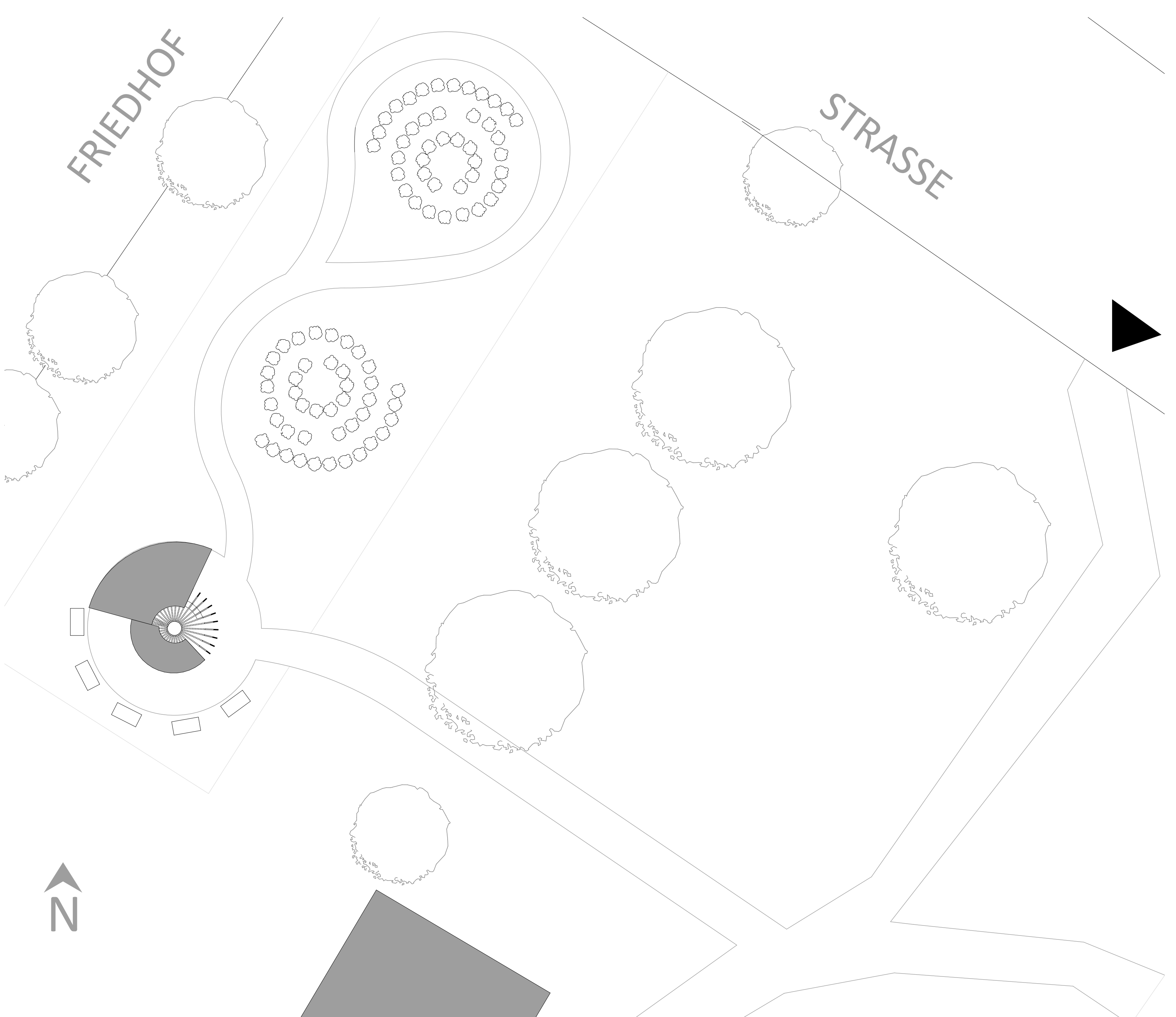
LAGEPLAN M 1:200