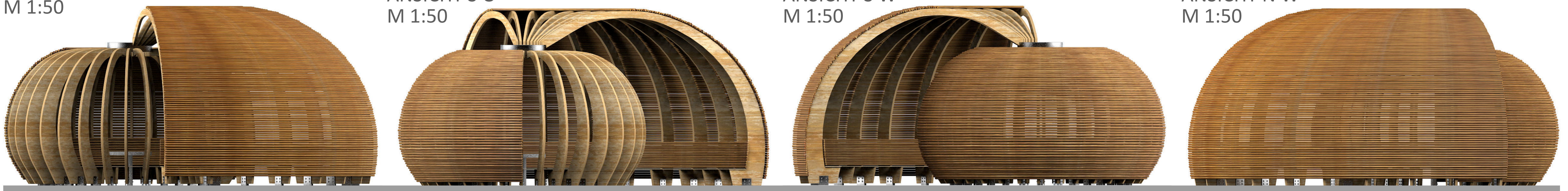
ANSICHT N W M 1:50